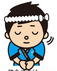
残念ですが 本年も中止致します

今年7月24日(土)25日(日)に行われる予定でした大芝原自治会納涼盆踊り大会の開催は、新型コロナウイルスの影響もあり、東京オリンピック2020開催の有無に関わらず、感染終息が見えない状況下では、大変残念ではありますが、昨年度に引き続き大会開催は無理と判断し中止とさせていただきます。